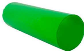
Ref. 17/031 120cm