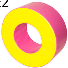
Ref. 17/089 Ø60x15x25cm