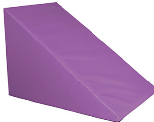
Ref. 17/380 70x50x50cm