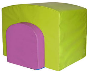
Ref. 17/379 70x50x55cm