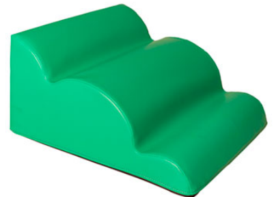
Ref. 17/061L 50x50x25cm