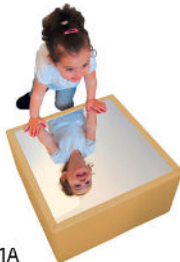
Ref. 17/041A 50x50x25cm