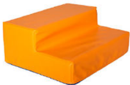
Ref. 17/378 40x50x20cm