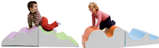
Ref. 17/244 130x60x30cm