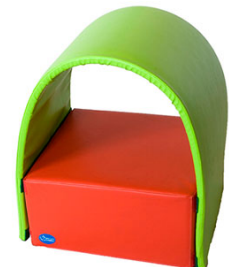
Ref. 17/387 50x50x75cm