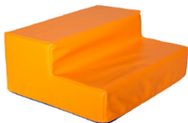
Ref. 17/378 40x50x20cm